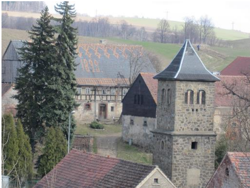
Widok na Pasiecznik