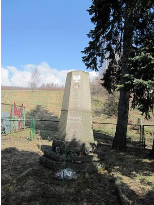
Pomnik: „NIE RZUCIM ZIEMI SKĄD NASZ RÓD” – pierwszy w województwie dolnośląskim, postawili kombatanci w 1947 r.