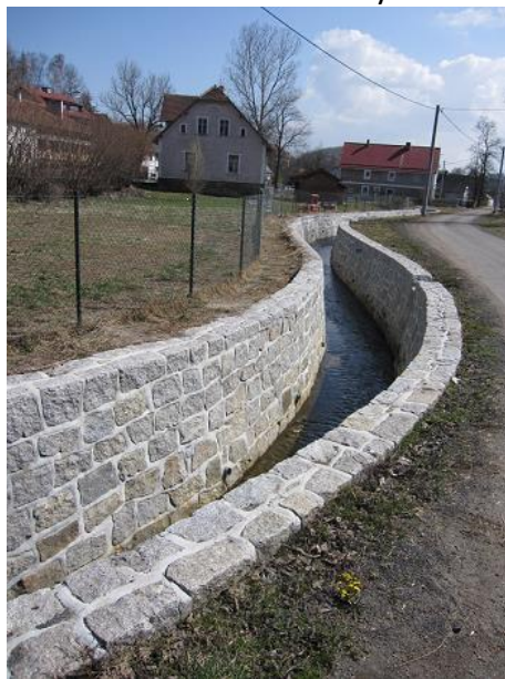
Inwestycje na terenie miejscowości.