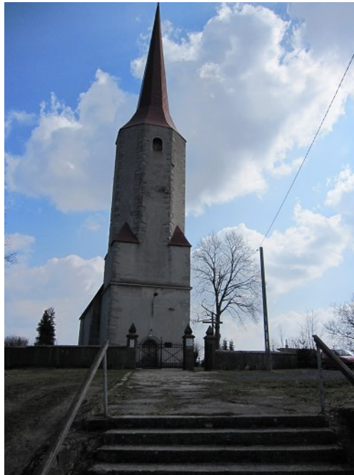
Kościół filialny pw. Św. Michała w Pasieczniku.