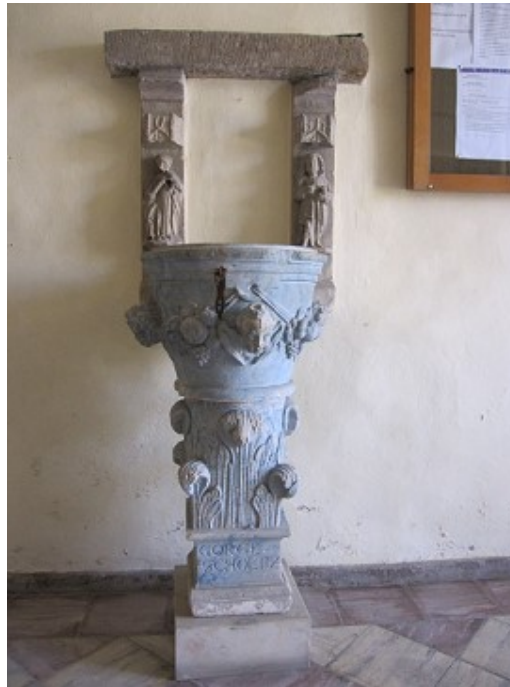
Zabytkowa chrzcielnica – 1602r.