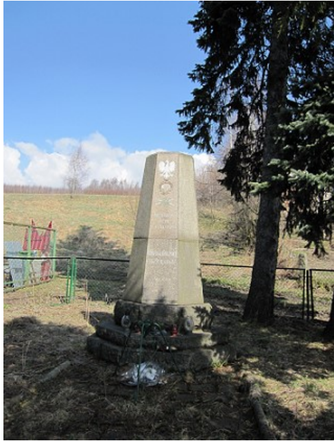
Pomnik: „NIE RZUCIM ZIEMI SKĄD NASZ RÓD” – pierwszy w województwie dolnośląskim, postawili kombatanci w 1947 r.