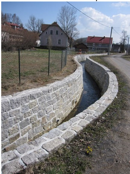
Inwestycje na terenie miejscowości.