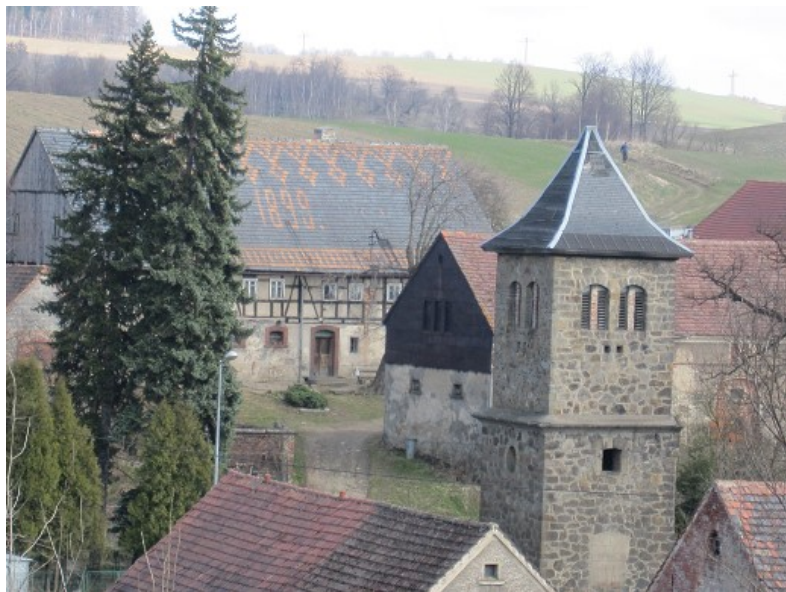
Widok na Pasiecznik