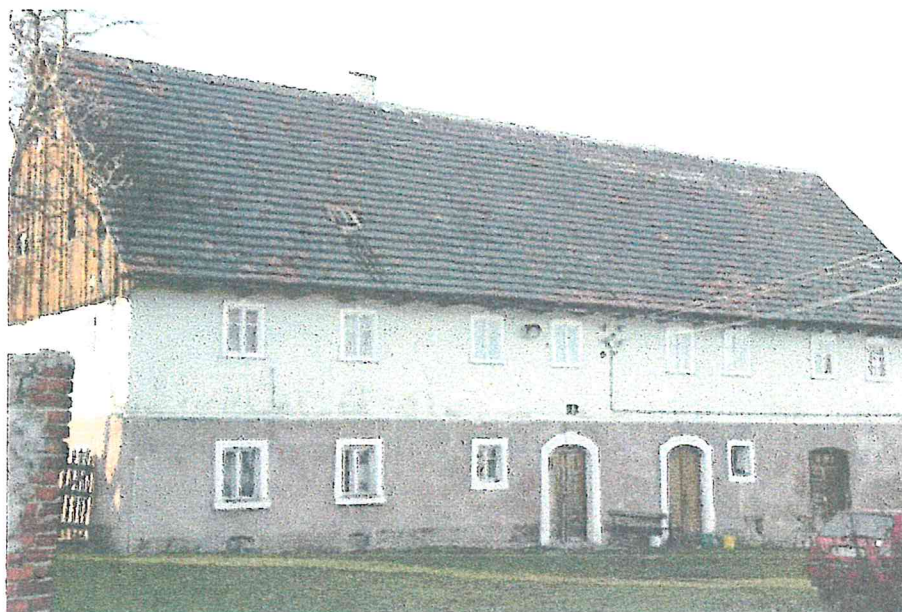
Popielówek. Budynek mieszkalny.